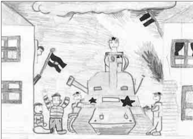
Cseke Ferenc rajza

1956. őszi eseményei nehezen feledhetők, a megkínzott, meggyalázott emberek számára pedig soha el nem múló sebeket ejtettek. Akik elég idősek ahhoz, hogy személyesen részt vehettek az egész országot megrendítő mozgalmakban, küzdelmekben, azokban is sokféle emlék és sokféle érzés kavarg. Több gyász, mint öröm. Így marad az örökké tartó néma gyász, a gyertyák gyújtása az eltávozottakért. Az emlékezők országszerte koszorúznak, s fejet hajtanak a névtelen áldozatok előtt.