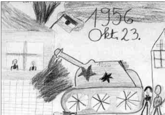
Pál Renáta rajza

Október 23. egy mai magyar embernek 1989 óta egy új államforma kikiáltását is jelenti.